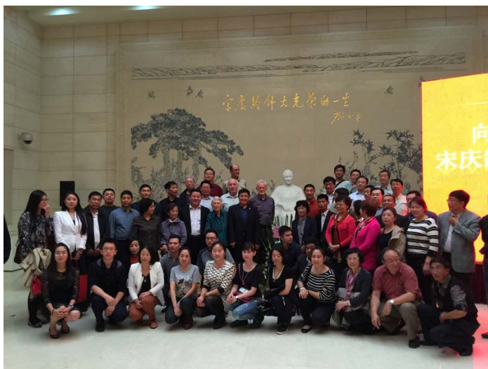
工合国际委员向宋庆龄雕像敬献鲜花

2015年10月16日，在工合国际第五届全委会代表大会来临之际，工合国际委员怀着无比崇敬的心情来到位于后海北沿的宋庆龄故居，瞻仰宋庆龄先生的雕像，并敬献鲜花。缅怀先人的丰功伟绩，激励后人砥砺前行。