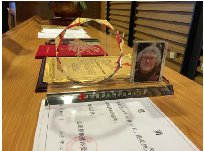
帕特同志遗体捐献证书